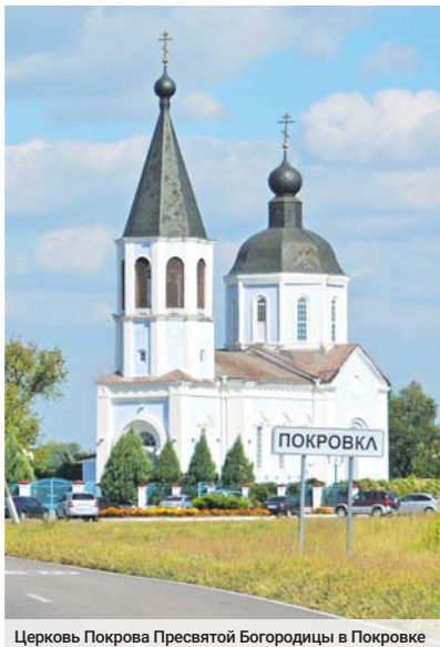
Церковь Покрова Пресвятой Богородицы в Покровке

КАК В ПОКРОВСКОМ СЕЛЬСКОМ ПОСЕЛЕНИИ ПОЗИТИВНЫЕ ПЕРЕМЕНЫ ПОВЛИЯЛИ НА БЫТ ЖИТЕЛЕЙ