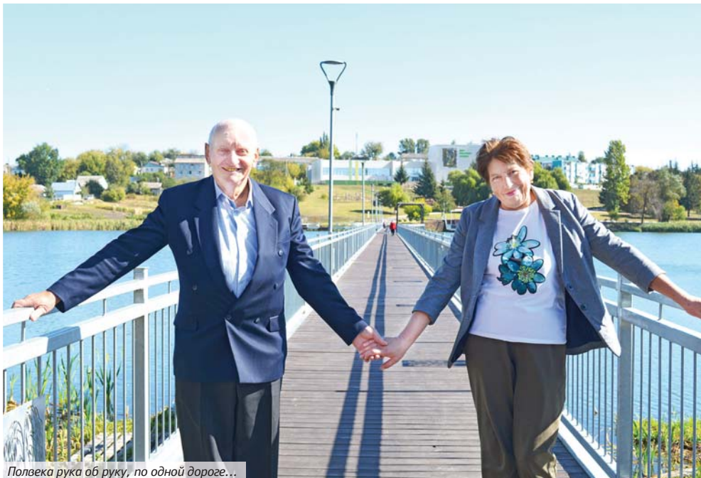
Полвека рука об руку, по одной дороге...

СУПРУЖЕСКАЯ ПАРА ИЗ КОЧЕТОВКИ СТОЙКО ПРОШЛА ЧЕРЕЗ ВСЕ ИСПЫТАНИЯ СУДЬБЫ И ТОЛЬКО УПРОЧИЛА СЕМЕЙНЫЙ СОЮЗ