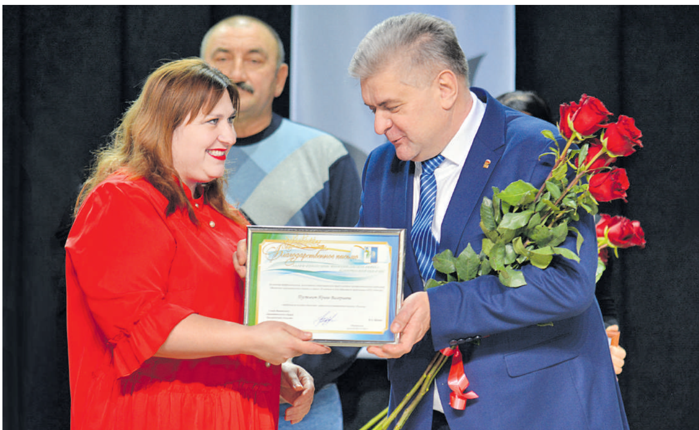
Награды за достойный труд

ДВЕ КРУПНЫЕ КОМПАНИИ ИВНЯНСКОГО КРАЯ ОТМЕТИЛИ ЮБИЛЕЙНЫЕ ДАТЫ