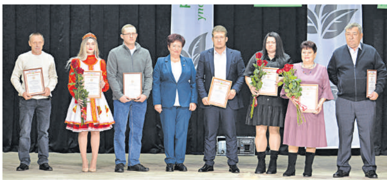
На церемонии награждения