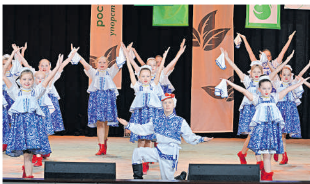
Подарок от юных артистов

3 декабря в Центре культурного развития п. Ивня собрались аграрии Ивнянского округа и Обоянского района Курской области, почётные гости. Известные в регионе и далеко за его пределами хозяйства отмечали юбилейные даты: ООО «Пчёлка» исполнилось 20 лет, компании «Владимировский сад» — 10 лет. Оба виновника торжества прошли длинный и трудный путь к своему успеху. И заслуга в том, конечно же, людей — от руководства до простого рабочего, — которые вывели хозяйства на высокий уровень производства.