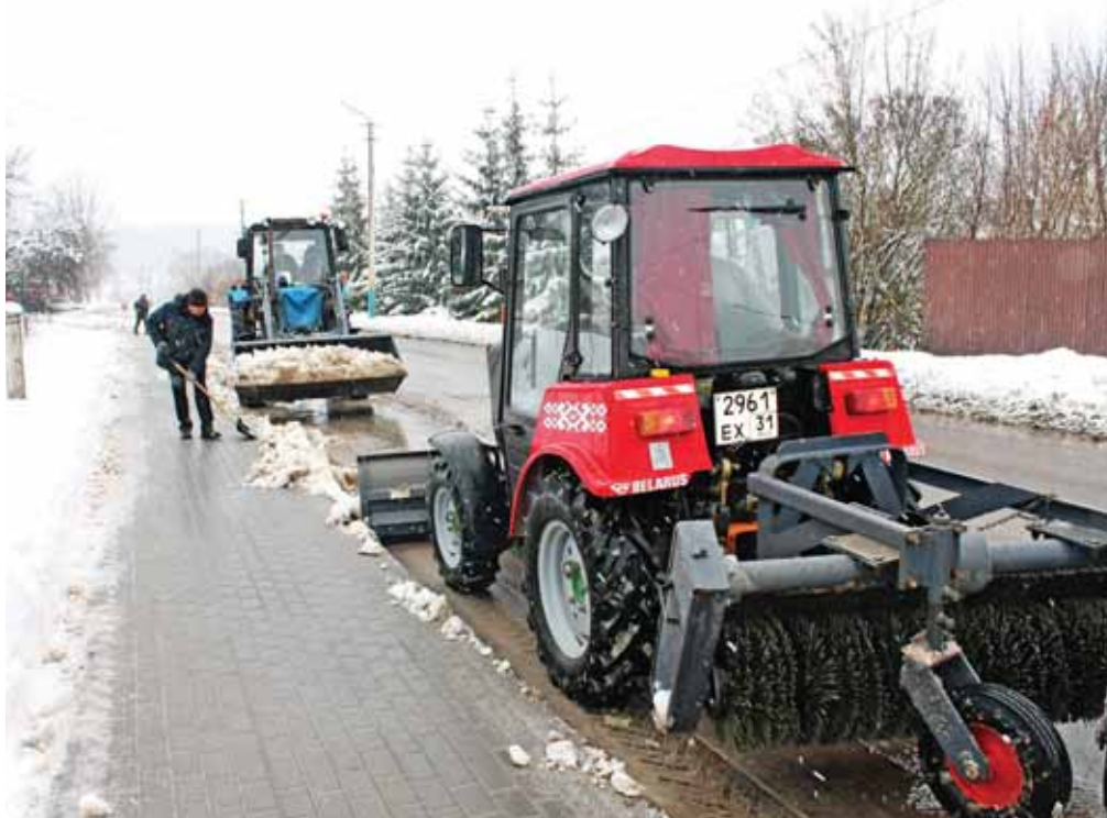
Уборка снега с тротуара на ул. Советской

КАК ИВНЯНСКИЕ КОММУНАЛЬЩИКИ ПРОТИВОСТОЯТ МАРТОВСКИМ СНЕГОПАДАМ