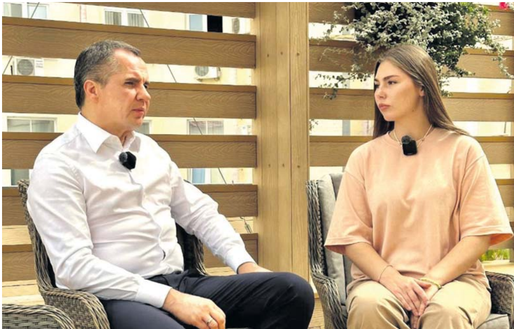
ПРЕСС-СЛУЖБА ГУБЕРНАТОРА И ПРАВИТЕЛЬСТВА ОБЛАСТИ

ГУБЕРНАТОР БЕЛГОРОДСКОЙ ОБЛАСТИ ВЯЧЕСЛАВ ГЛАДКОВ ДАЛ ЭКСКЛЮЗИВНОЕ ИНТЕРВЬЮ ВОЕНКОРУ ПЕРВОГО КАНАЛА, ЧЕТЫРЁХКРАТНОЙ ЧЕМПИОНКЕ МИРА ПО ПАУЭРЛИФТИНГУ МАРЬЯНЕ НАУМОВОЙ