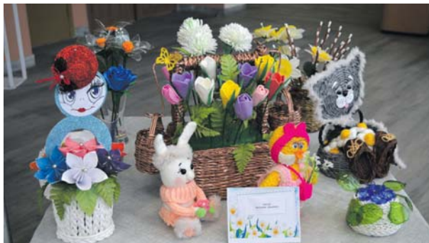
Изделия ивнянских мастериц

Первый весенний праздник был ознаменован огромным букетом мероприятий и поздравлений для прекрасной половины ивювского края. Они собрали виновниц торжества по всем поселениям муниципалитета.