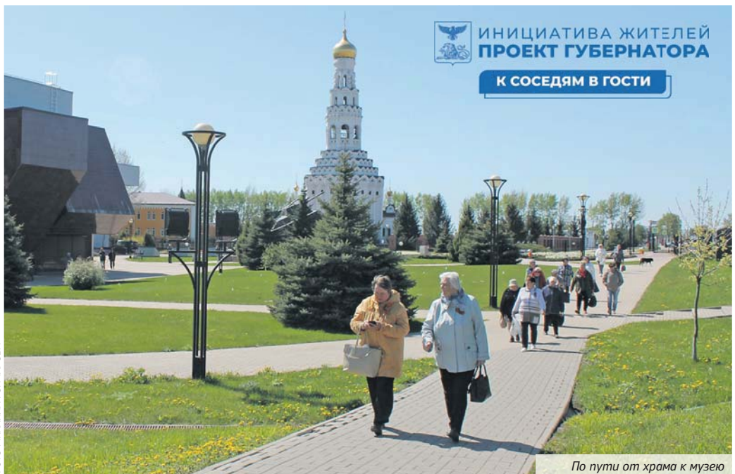
По пути от храма к музею

Первая экскурсия ждала ивнянцев в военно-историческом музее-заповеднике Третьего ратного поля России «Прохоровское поле». Экскурсоводы рассказали, что Прохоровка была образована в 1836 году как станция Курско — Азовско — Харьковской железной дороги. А одноимённый район возник в июле 1928 года после раздела бывшей Курской губернии. В настоящее время Прохоровский и Ивнянский районы приблизительно равны по населению, по промышленно-сельскохозяйственному