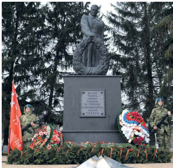
В день освобождения района в Ивне проходит традиционный памятный митинг

После провала под Сталинградом озверевшие нацисты провели в районе новую волну карательных акций. Было арестовано от 300 до 600 мирных жителей, которых согнали в подвалы полицейского управления (сейчас в этом здании