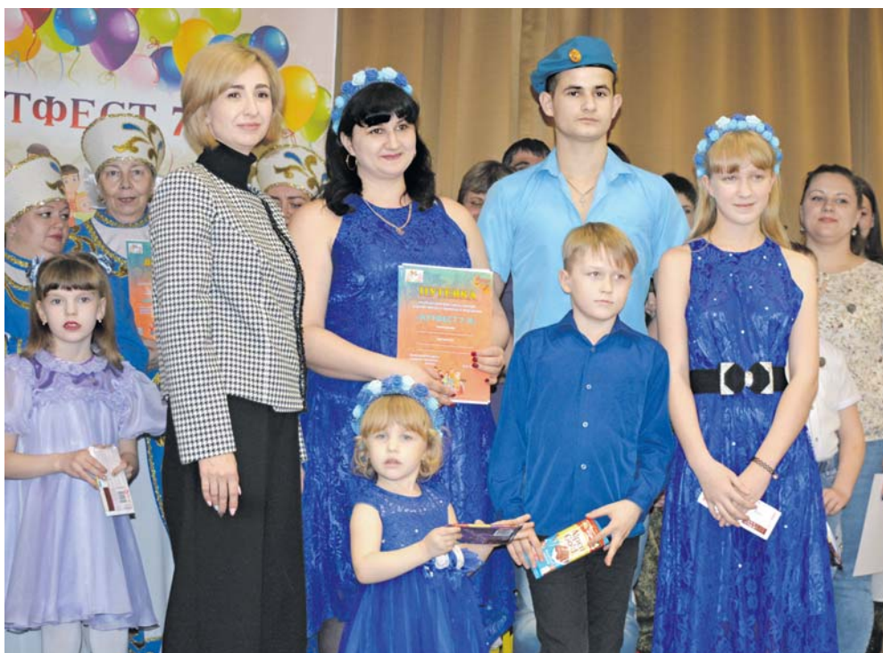
Все члены семьи Ореховых увлечены творчеством

ИВНЯНСКИЕ СЕМЬИ ПРЕДСТАВИЛИ НА СУД ЗРИТЕЛЯ СВОЁ ТВОРЧЕСТВО