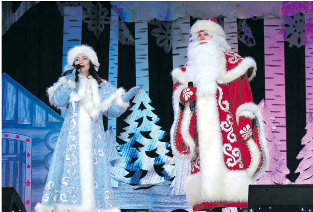
Дед Мороз и Снегурочка — неизменные герои Нового года

ИВНЯНСКИЕ РАБОТНИКИ КУЛЬТУРЫ ПОДАРИЛИ ДЕТВОРЕ НОВОГОДНЕЕ ПРЕДСТАВЛЕНИЕ