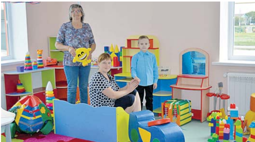
В новом корпусе Сафоновского детского сада

За последние годы в области и районе неуклонно растёт число капитально отремонтированных и построенных образовательных учреждений.