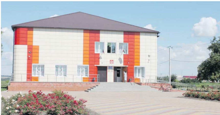
Дом культуры заметно похорошел и радует глаз местных жителей

КАК В ЧЕРЕНОВСКОМ ПОСЕЛЕНИИ РЕАЛИЗОВАЛИ НАКАЗЫ ДЕПУТАТАМ ОБЛДУМЫ