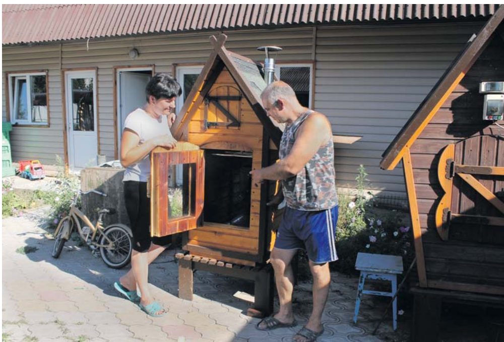
Лайковы показывают самодельную коптильню

КАК БЫВШИЕ ВОЕННОСЛУЖАЩИЕ СЕВЕРНОГО ФЛОТА ОБЖИЛИСЬ В ИВНЕ